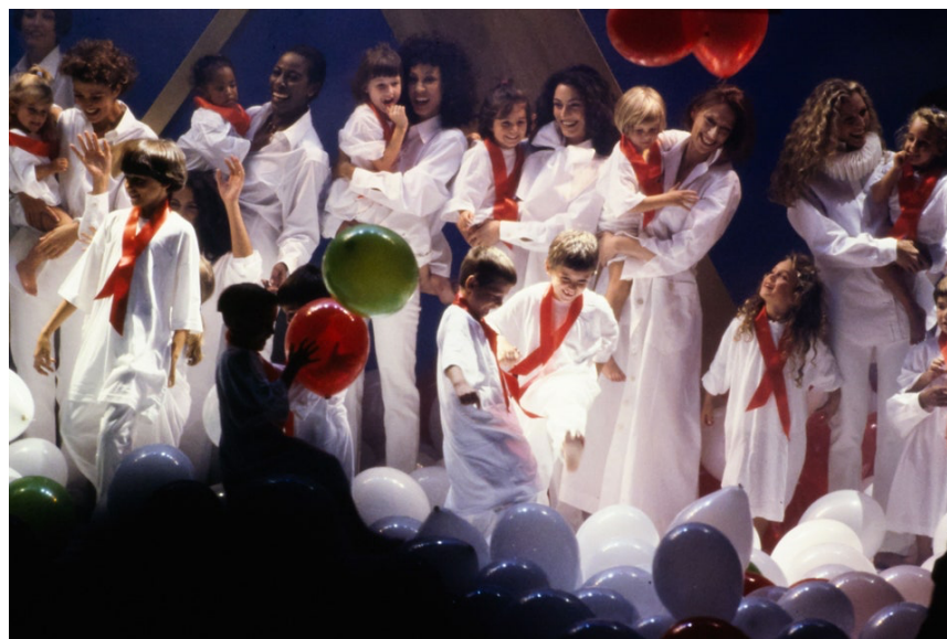
Figura 6: Moschino Prêt-à-Porter Primavera-Verão 1994.

campanhas pontuais para arrecadação de fundos de amparo a crianças portadores do vírus HIV (como a “Smile!”, em 1993) lançadas nos dois últimos anos de sua carreira.