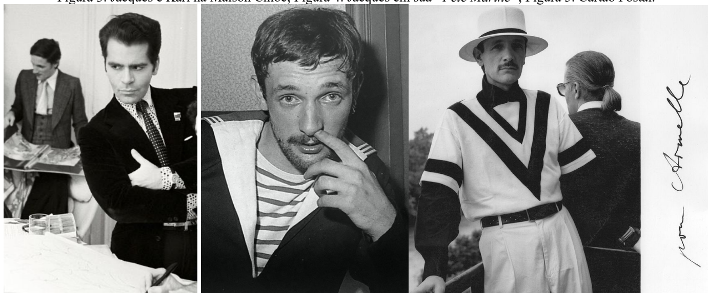
Figura 3: Jacques e Karl na Maison Chloé; Figura 4: Jacques em sua “ Fête Marine ”; Figura 5: Cartão Postal.