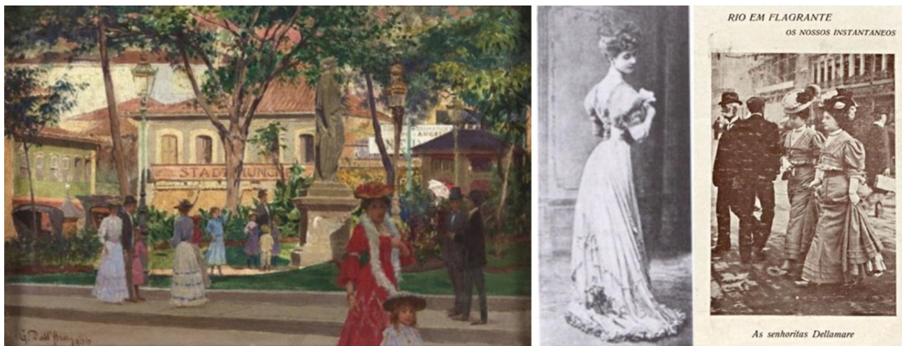
Figura 1: DALL'ARA, Gustavo Giovanni. Praça Tiradentes (com o restaurante Stadt München) (1906). Óleo sobre tela. 62x46 cm. Coleção da Casa Geyer, RJ, Museu Imperial de Petrópolis. / Seção Atravez da moda, O Mez de abril de 1907. / Coluna Rio em Flagrante: os nossos instantaneos . As senhoritas Dellamare.

Fontes: Google Arts & Culture. / FEIJÃO, Rosane. Moda e modernidade na belle époque carioca . – São Paulo: Estação das Letras e Cores, 2011. / Semanário Fon-Fon! , 25 de maio de 1907, 7ª ed., p. 08. In: Hemeroteca Digital da Biblioteca Nacional Brasileira.