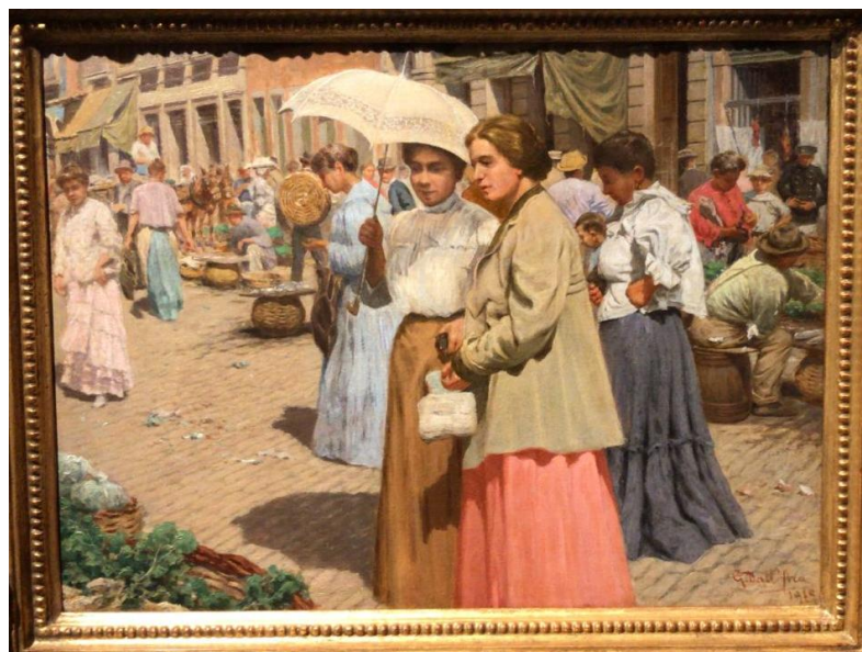
Figura 4: DALL'ARA, Gustavo Giovanni. Mercado do Largo do Capim (1915). Óleo sobre tela. Centro Cultural Unifor, CE.