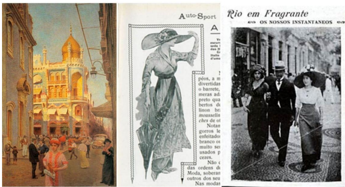
Figura 3: DALL'ARA, Gustavo Giovanni. Casa Persa na Rua do Rosário (1914). Óleo sobre tela. 75,50 x 46,50 cm. Coleção Fadel, RJ. Reprodução fotográfica de Henrique Sodré. / Auto-Sport . Fragmento da coluna de moda com vestido de saia-funil. 1912. / Coluna Rio em Fragrante: os nossos instantaneos . 1912.

Fontes: ENCICLOPÉDIA Itaú Cultural de Arte e Cultura Brasileira. São Paulo: Itaú Cultural, 2024. Disponível em: http://enciclopedia.itaucultural.org.br/obra12556/casa-persa-na-rua-do-rosario-rio-de-janeiro . Acesso em: 30 de janeiro de 2024. Verbete da Enciclopédia / Auto-Sport , 1912, 1ª ed., p. 79. In: Hemeroteca Digital da Biblioteca Nacional Brasileira / Semanario Fon-Fon! , 13 de janeiro de 1912, 2ª ed., p. 37. In: Hemeroteca Digital da Biblioteca Nacional Brasileira.