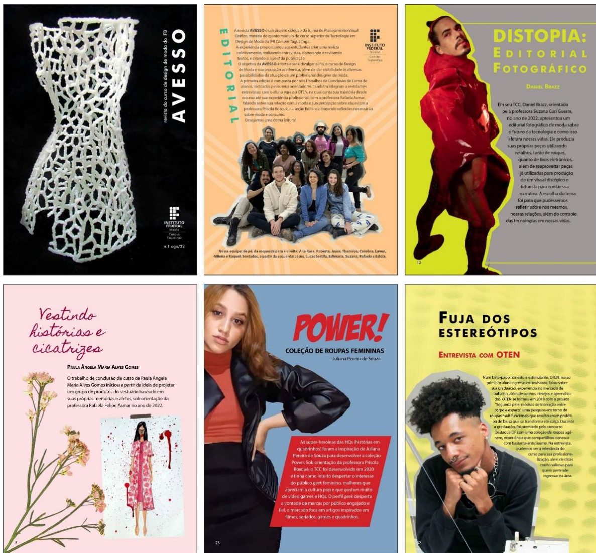
Figura 1: Páginas da revista Avesso nº 1, 2022.

DE 30 DE SETEMBRO A 03 DE OUTUBRO DE 2025