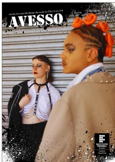
Figura 3: Páginas da revista Avesso nº 3, 2024.

DE 30 DE SETEMBRO A 03 DE OUTUBRO DE 2025