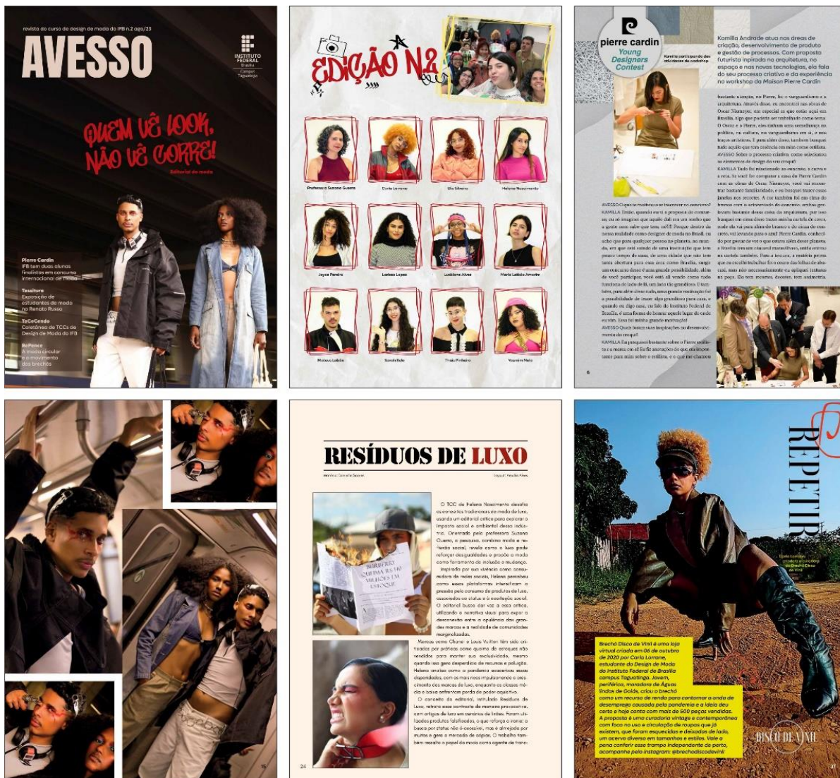
Figura 2: Páginas da revista Avesso nº 2, 2023.

DE 30 DE SETEMBRO A 03 DE OUTUBRO DE 2025